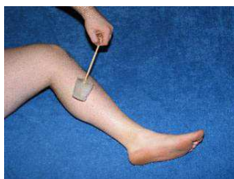
Rysunek 6 - masaż "lodem na patyku"

Poprawę stanu przynosi jedynie rzetelne schłodzenie tkanek. A to podyktowane jest chłodzoną powierzchnią ciała i zależnie od przyjętego czynnika chłodzącego - czasem chłodzenia. Podczas stosowania rozprężanego gazu zabieg trwa od 1 do 3 minut. Przy pomocy zimnego okładu czy zimnej wody należy chłodzić miejsce dość długo - nawet do 30 minut. Najlepiej też nie ograniczać się jedynie do chłodzenia miejsca bezpośredniego urazu, lecz schłodzić też sąsiednie okolice. Jeśli kontuzja dotyczy palca to włóż pod kran całą rękę. Jeśli masz stłuczoną piszczel to ochłódź całą goleń.