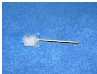
Rysunek 5 - zawartość kubka po wyjęciu

Poprawę stanu przynosi jedynie rzetelne schłodzenie tkanek. A to podyktowane jest chłodzoną powierzchnią ciała i zależnie od przyjętego czynnika chłodzącego - czasem chłodzenia. Podczas stosowania rozprężanego gazu zabieg trwa od 1 do 3 minut. Przy pomocy zimnego okładu czy zimnej wody należy chłodzić miejsce dość długo - nawet do 30 minut. Najlepiej też nie ograniczać się jedynie do chłodzenia miejsca bezpośredniego urazu, lecz schłodzić też sąsiednie okolice. Jeśli kontuzja dotyczy palca to włóż pod kran całą rękę. Jeśli masz stłuczoną piszczel to ochłódź całą goleń.