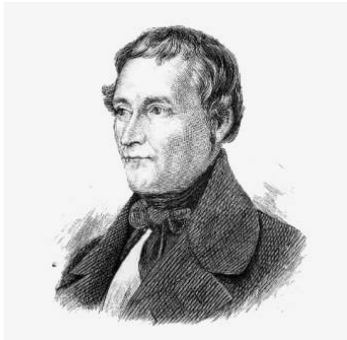
Rysunek 2 - Vincenz Priessnitz

Hydroterapia zwana wodolecznictwem wyodrębniła się około 1865r. Jej prekursorem był Vincenz Priessnitz (1799-1851), chłop śląski, który w swym gospodarstwie w Grafenbergu założył pierwszy zakład wodoleczniczy. Priessnitzowi zawdzięczamy między innymi jeden z zabiegów odnowy biologicznej - natrysk spadowy lub deszczowy. Od nazwiska twórcy, popularnie zwany prysznicem. Potreningowe zażycie prysznica nie musi ograniczać się jedynie do celów higienicznych. Proponuję wypróbować natrysk zmiennocieplny, jako jeden z najbardziej dostępnych i najłatwiejszych do samodzielnego wykonania zabiegów. Podczas natrysku zmiennocieplnego przemiennie stosuje się wodę gorącą oraz zimną. Metodami statystycznymi określono, iż granice "wody gorącej" wyznacza temperatura od 38 do 42°C, "wody zimnej" od 8 do 20°C. Wiadome i oczywiste jest to, że co dla jednego jest ciepłe, dla innego może być zimne. Odczucia termiczne są indywidualne, każdy z nas będzie stosował inne, subiektywne wartości temperatury, zależne od predyspozycji, samopoczucia, ilości poprzednich zabiegów.