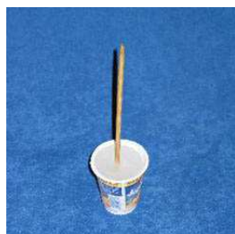
Rysunek 4 - zmrożony kubek

Skuteczne schłodzenie może zapewnić nam chlorek etylenu - chłodzący spray. Nie należy on jednak do podstawowego i najtańszego wyposażenia apteczki. Podobnie zimne okłady żelowe, które powinny być każdorazowo schładzane w lodówce i zabierane na trening. Szczerze zachęcam do kupna i używania tych środków, jednocześnie zdaję sobie sprawę, iż najczęściej stosowanym środkiem pierwszej pomocy jest zimna woda, jeśli oczywiście schładzana część ciała zmieści się pod kranem. Świadomi krzywdy, jakiej możemy doznać, lepiej zabezpieczmy się na jej ewentualność. Możemy wcześniej, w domu, przygotować "loda na patyku". Stosowany nie tylko w domowej terapii stanowi nieocenioną pomoc przy różnego typu kontuzjach. Potrzebny jest plastikowy pojemnik, patyk, woda i zamrażarka. Tak spreparowaną kostką lodu możemy rozcierać bolące miejsce.