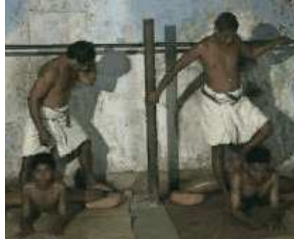
Rysunek 1 - masaż kalari

Należy zauważyć, iż jest to regularna szkoła, a raczej studia, których uczestnicy spędzają wiele godzin dziennie na poznawaniu tajników swojego fachu. Idea Kalari Payat to wyśmienity przykład na istnienie złotego środka - równowagi pomiędzy antagonizmami: pracą - relaksacją; walką - leczeniem; zadawaniem bólu - przynoszeniem ulgi.